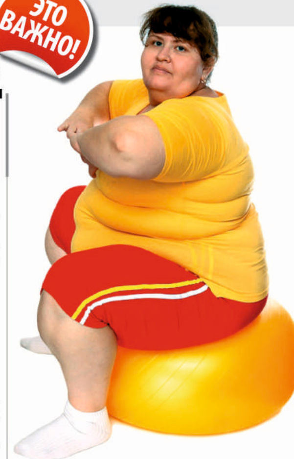
Информация предоставлена ФГУ ГИИЦ Профилактической Медицины Роспотребнадзора. Под редакцией кандидата мед. наук Е.А. Егоровой. © Министерство здравоохранения и социального развития Российской Федерации, 2009