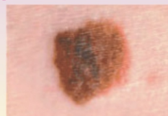
Меланома - диаметр больше 6 мм

При малейших подозрениях на злокачественное образование кожи – проконсультируйтесь у онколога.