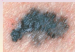
Меланома - граница неровная