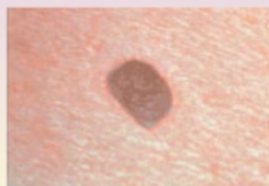
Невус - диаметр меньше 6 мм