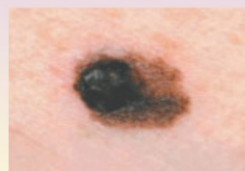
Меланома - асимметричная