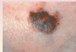
Меланома - цвет неоднородный