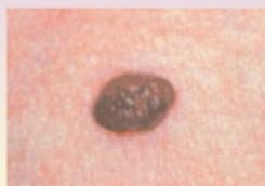
Невус - граница ровная