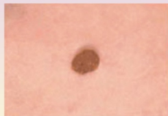
Невус - цвет однородный